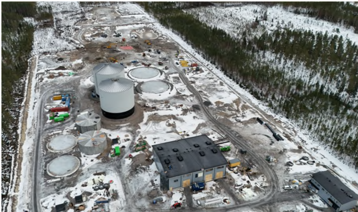
Nurmon Bioenergian rakennusvaihe helmikuussa 2025.

Rakennustyöt valmistuvat vuoden 2025 loppuun mennessä, minkä jälkeen laitetoimittajien asennukset jatkuvat kevääseen 2026 asti. Samalla suunnittelemme jo tulevia laajennuksia.