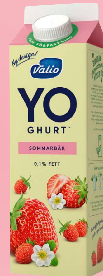
YO-ghurt Sommarbär 0,1 %, 1000 g Art.nr: 208688

Innehåll: Högpastöriserad skummjölk, socker 8 %, jordgubbar, hallon, blåbär, lingon, modifierad majsstärkelse, aromer och yoghurtkultur. Yoghurten innehåller 2 % bär.