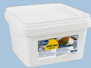
Smetana 42 %, 2 kg Art.nr: 4108

Innehåll: Pastöriserad mjölk och grädde , mjölkpulver och syrningskultur.