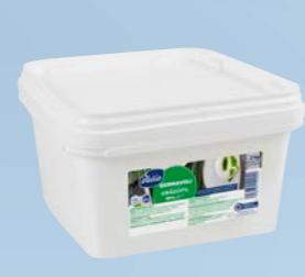
Gräddfil 10 %, 2 kg Art.nr: 14204

Innehåll: Pastöriserad grädde och syrningskultur.