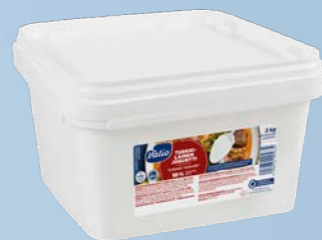
Turkisk Matyoghurt 10 %, 2 kg Art.nr: 209563

Innehåll: Pastöriserad grädde , modifierad majsstärkelse, förtjockningsmedel (guarkärnmjöl, fruktkärnmjöl och pektin), syrningskultur.