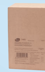
Vispgrädde, BiB 38 %, 10 L Art.nr: 1465