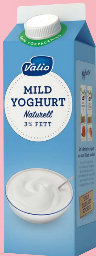
Mild Yoghurt Naturell 3 %, 1000 g Art.nr: 220202