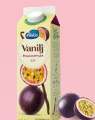
Vanilj™Yoghurt Passionsfrukt 2,2 %, 1000 g Art.nr: 220341

Innehåll: Högpastöriserad mjölk, socker (8 %), jordgubbar (3 %), smultron (0,5 %), förtjockningsmedel (modifierad potatisstärkelse, guarkärnmjöl), aromer, vaniljextrakt, färg (rödbetsrött), yoghurtkultur, Lactobacillus acidophilus , Bifidobacterium sp. och D-vitamin.