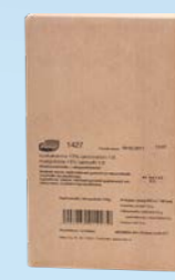
Matgrädde, BiB 15 %, 10 L Art.nr: 1427