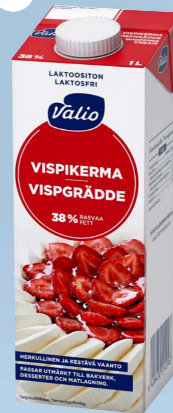
Vispgrädde 38 %, 1 L Art.nr: 1499