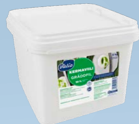
Gräddfil 10 %, 5 kg Art.nr: 406

Innehåll: Grädde , vatten, modifierad majs och tapiokastärkelse.