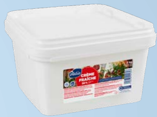
Crème Fraîche 28 %, 2 kg Art.nr: 4134